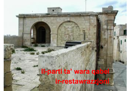
Il-parti ta' wara qabel ir-restawrazzjoni