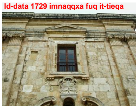
Id-data 1729 imnaqqxa fuq it-tieqa