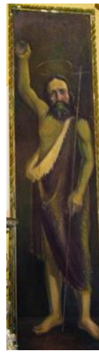
Ġwann. Kienu saru fl-1670.