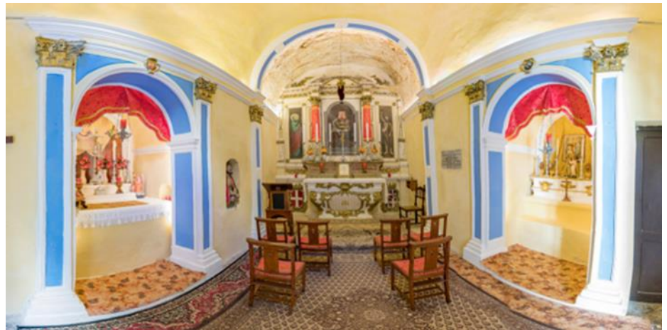
Barbara (il-protettriċi tal-bumbardieri).

Meta l-Ordni ta' San Ġwann ħa l-pussess tal-Kastell, din il-knisja xorta baqgħet taħt il-ġurisdizzjoni tal-Isqof, bl-Arcipriet tal-Birgu r-rappreżentant tiegħu. Il-wasla tal-Ingliżi fissret li dawn ħadu wkoll il-Kastell taħt idejhom. Imma xorta waħda n-nies tal-Birgu baqgħu jgawdu d-dritt li fis-7 u t-8 ta' Settembru ta' kull sena jidhlu biex jiffestegġaw il-Jum tar-Rebħa ta' Malta nhar it-Twelid ta' Marija.