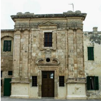
Il-faċċata qabel ir-restawrazzjoni