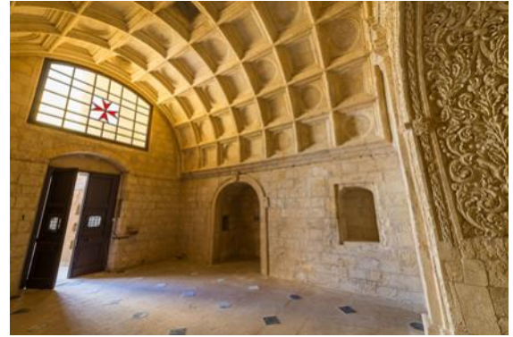
Perspettiva minn ġewwa