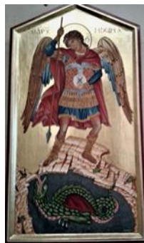
San Mikiel Arkanġlu

f'kompartmenti bil-pannelli u hemm ukoll koppla baxxa iddekorata b'pittura stil Bizantin. Il-kappella fiha altar wieħed.