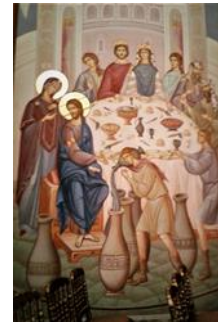
It-Tieg ta' Kana

Apportlu; it-Twelid ta' Kristu; il-Verġni ta' Hodigitrija; Ikonostasis portabli li fiha għadd ta' xbiat; San Mikiel-