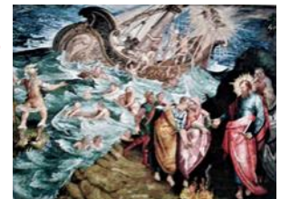
In-Nawfraġu ta' San Pawl f' Malta

għax kien jaqbel aktar mall-istil Ortodoss Russu.