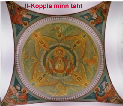
Il-Koppla minn taht

u koll stained-glass li kkumplimenta l-kappella