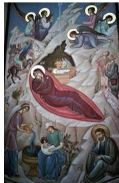
It-Twelid ta' Kristu

Il-kappella, bi stil Neo-Klassiku, għandha forma ta' Salib Latin. Fiż-żewġ navi dojoq tal-ġenb hemm kolonni ta' stil Doriku, waqt li fuq il-bieb li jħares lejn il-Lvant hemm gallerija. Is-saqaf troll huma maqsuma