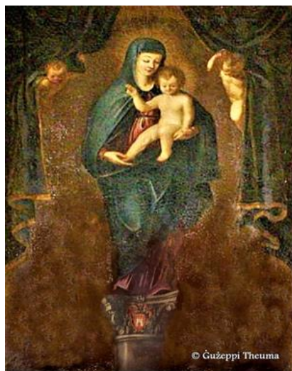
Il-Madonna tal-Pilar Pittur mhux magħruf Kappella Il-Madonna tal-Pilar (Sant Anton) - Attard

Il-palazz serva bħala il-post fejn kienu jiltaqgħu l-Maltin fl-Assemblea Nazzjonali meta il-Maltin irribellaw kontra il-Franciżi tul il-perjodu 1798–1800. Tul il-perjodu tal-hakma Ngliza sal-1964, intuża bħala ir-residenza uffiċjali tal-Kummissarji u l-Gvernaturi. Sa mill-1974 beda jinktuża bħala r-residenza tal-President ta' Malta.