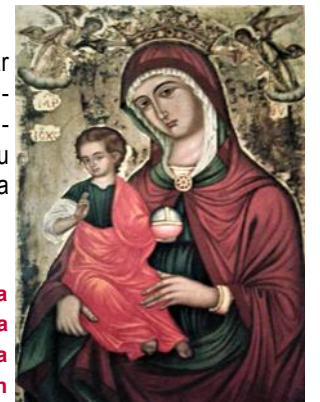
Ikona tipika Bizantina tal-Madonna bil-Bambin

ix-xahar ta' Jannar fiha jiġi ċċelebrat il-Milied skont il-kalendarju liturġiku tal-Knisja Russa Ortodossa.