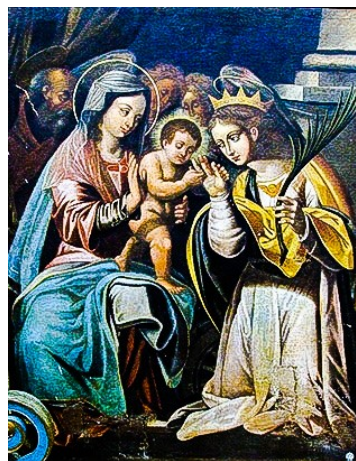
Titular: iż-Żwieġ Mistiku ta' Santa Katarina

Il-bieb prinċipali hu rettangolari u hu mdawwar minn gwarniċun tal-ġebel. Fuqu hemm tieqa kwadra. 'L fuq minn din it-tieqa hemm arma li iżda hi sfigurata. Fuq kull naħa tal-bieb prinċipali hemm tieqa kwadra fil-baxx.