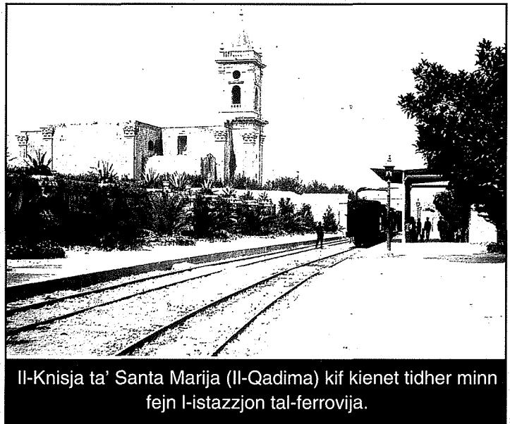
Il-Knisja ta' Santa Marija (Il-Qadima) kif kienet tidher minn fejn l-istazzjon tal-ferrovija.

Fiz-zewg kampnari hemm sett qniepen bil-kbira l-aktar maghrufa fil-Gzejjer Maltin kemm ghall-kobar taghha kif ukoll ghat-ton uniku taghha. Saret mid-Ditta Barigozzi ta' Milan u tpoggiet fil-post taghha fin-nofs tal-kampnar tan-naħa tax-xellug fl-1932. Fit-18 ta' Jannar