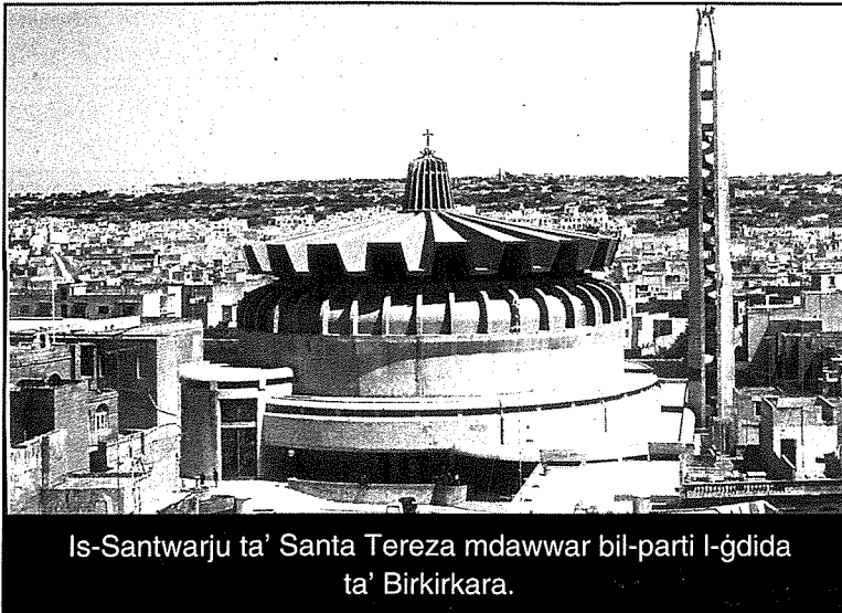
Is-Santwarju ta' Santa Tereza mdawwar bil-parti l-gdida ta' Birkirkara.

jqisuha bhala Gawrha ta' l-Arkitettura. Fil-prezent din il-knisja qeghda taqdi l-ftigijiet spiritwali tan-nies ta' l-inhawi peress li dawn ghandhom xi ftit tal-boghod ghall-Bazilika ta' Sant'Elena. Hawn min isejhilha bl-isem ta' Santa Marija, ohrajn isibuha bl-isem tal-Parrocča l-Qadima.