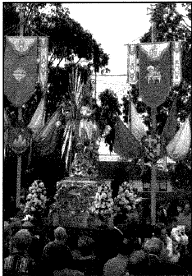
Il-purċissjoni bl-istatwa ta' Marija Bambina fi Greystanes fl-Awstralja. Ma' l-arbru tan-naha tal-lemin tidher l-arma tal-Isla.

Dawn l-imsejnkna kellhom joqogħdu fit-tined u kienu jaqilghu xi haġa tal-flus billi jbigħu l-haxix u l-frott. Ohrajn ta' qalb tajba ppruvaw jintervjenu mal-Gvern biex ibiddel l-attitudni tiegħu ma' dawk il-Maltin iżda kien kollu għalxejn uħud