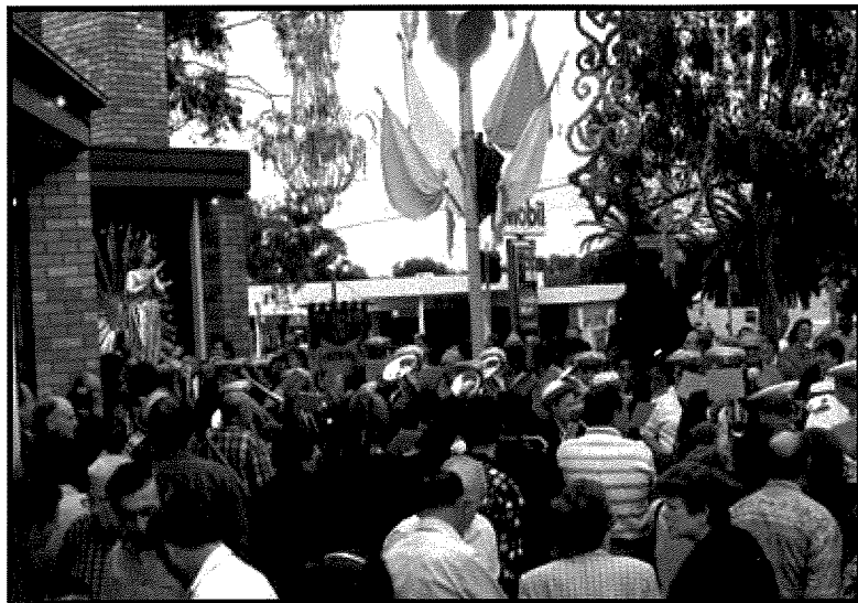
L-Istatwa ta' Marija Bambina hierġa mill-knisja ta' Greystanes fl-Awstralja.