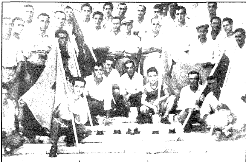
Għadd ġmielu ta' qaddiefa Sengleani flimkien ma' xi partitarji, miġburin flimkien f'ras it-taraġ tal-Ponta għar-ritratt, wara r-rebħa ta' erba' paljijiet ta' l-ewwel fl-1953.

monument żgħir tal-gebel b'kwadru bix-xbieha tal-Madonna tal-Portu Salvu taht il-mina (Sully Port) li tagħti għal Triq is-Sirena u li minnha taqbad it-taraġ biex tinzel il-Ponta.