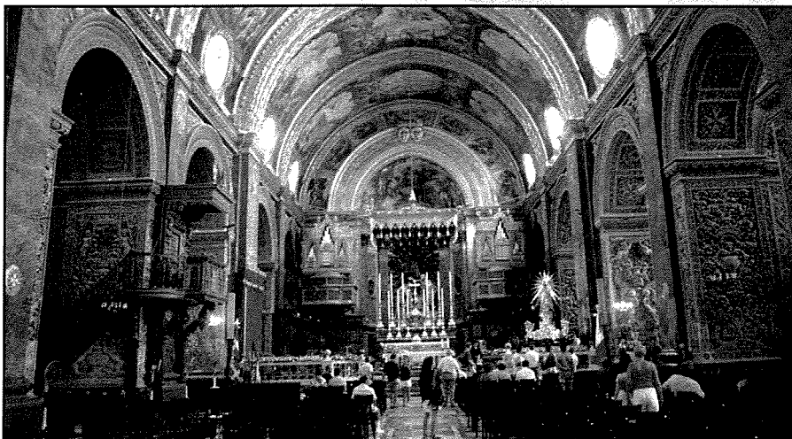
L-istatwa tal-Bambina fil-Kon-Katidral ta' San Ġwann fil-Belt Valletta fl-1996.