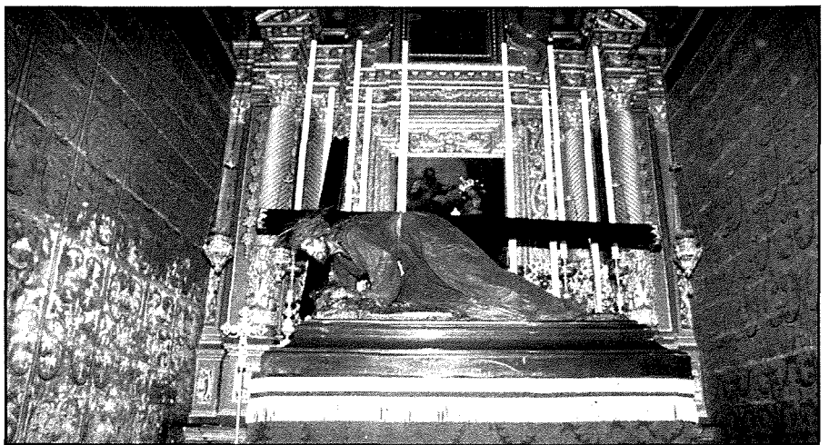
L-istatwa ta' Ġesù Redentur fil-gżira ta' Ghawdex ġewwa l-kappella tal-Kunċizzjoni fil-Qala. F'Mejju 2000 fl-okkażjoni tal-Ġublew il-Kbir.

Il-poplu Senglean se jibqa' grat lejha għall-ġid pastorali li wettaq fost il-komunità. Dan intwera fl-ahhar quddiesa ta' ringrazzjament li ċcelebra fil-Bażilika, meta lanqas kien hemm fejn toqghod labra. Grazzi ta' kollox.