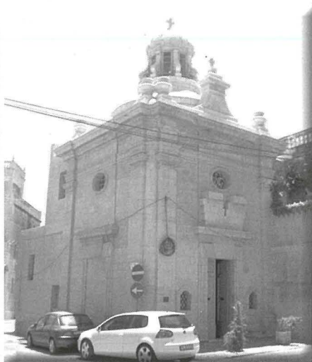
Il-Knisja ta' Santa Marija qabel u wara r-restawr