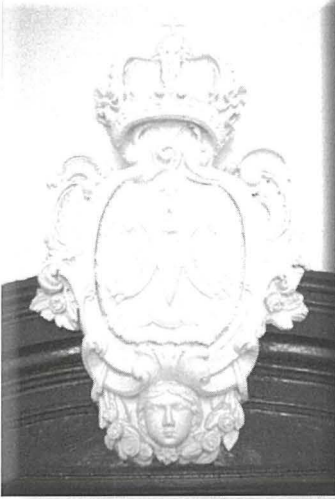
Skultura fuq il-bieb

responsabbli ta' dan kienet il-Perit Jean Frendo. Għal din il-hidma f'isem il-poplu ta' Hal Lija nirringrazzjaw lil dawk kollha li ħadmu u għenu f'dan il-proġett. Issa nħarsul 'l quddiem għax-xogħol li jmiss! Bħal ma tistgħu tobsru, għalkemm l-għajjnuna kienet kbira, hemm numru ta' spejjeż li jridu jsiru mill-parroċċa.