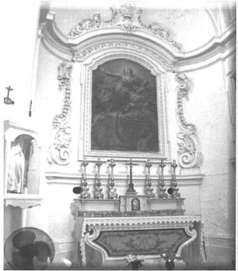
Il-knisja minn gewwa