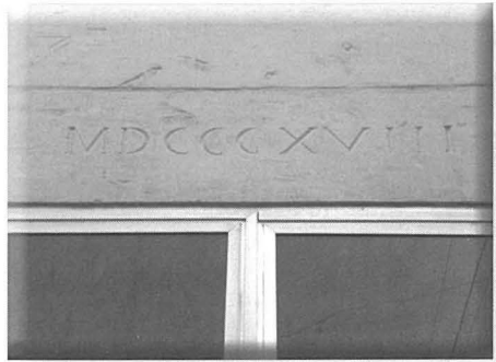
IS-sena 1818 minquxa fuq bieb fil-kumpless