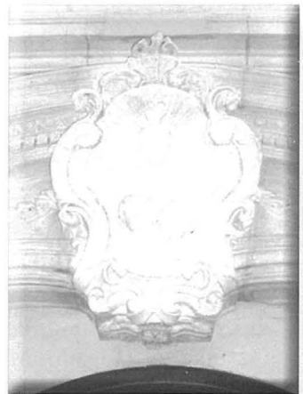
Skultura f' dar fil-qrib