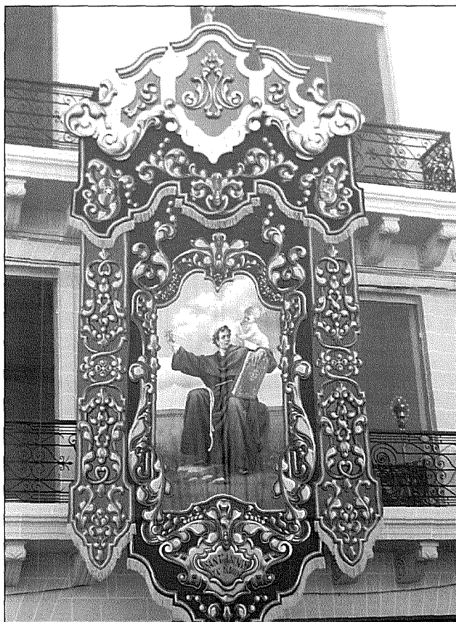
Il-bandalora ta' Sant'Antnin ta' Padova li kienet lesta bil-pittura u l-isfumar għall-festa tal-2009

San Albertu l-Kbir (Patri Dumnikan, Duttur tal-Knisja u Isqof; c.1200-1280)