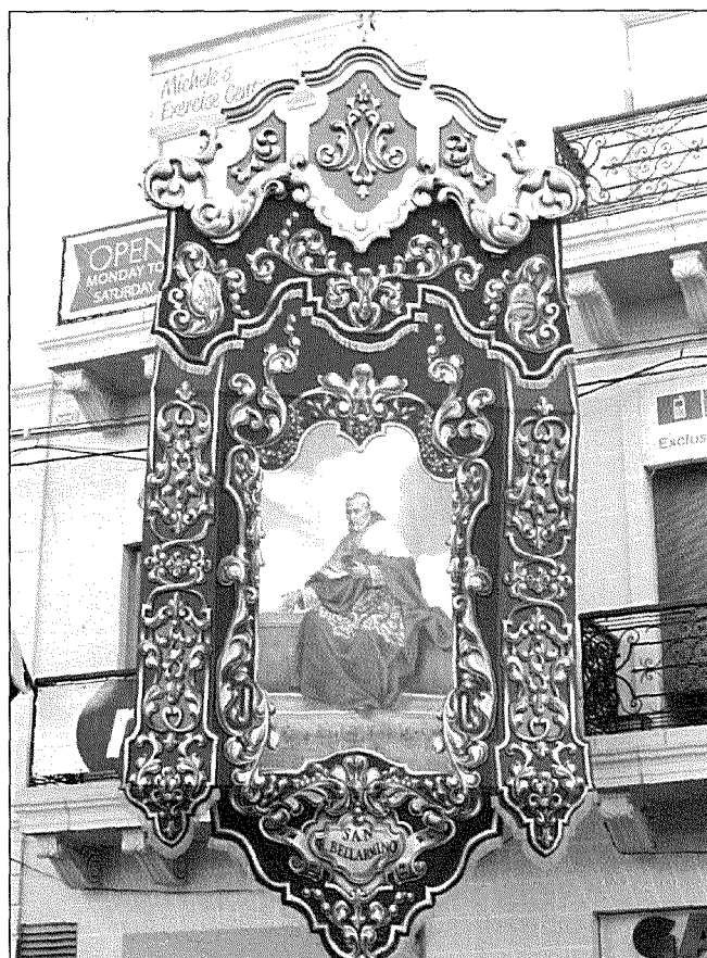
Il-bandalora ta' San Roberto Bellarmino li kienet lesta mill-pittura u l-isfumar għall-festa tal-2013

l-Verġni Marija giet imtelligħa s-Sema bir-ruħ u l-ġisem għax ladarba Alla kien żamm il-verġinità tagħha intatta kemm waqt il-konċepiment kif ukoll waqt it-twelid tal-Mulej Ġesù, żgur li qatt ma seta' jippermetti li ġisimha jara t-tahsir. Id-Duttur Serafiku jfisser li r-ruħ minnha nnfisha mhix persuna għax persuna hi biss magħmula minn ruħ u ġisem. Għalhekk filwaqt li jagħmel riferenza għall-Iskrittura mqaddsa jgħidilna li l-fatt li l-Verġni Marija tinsab fil-milja tal-grazzja jfisser li din il-milja setgħet tilhaqha biss għaliex hi tinsab fis-Sema kollha kemm hi bħala persuna.