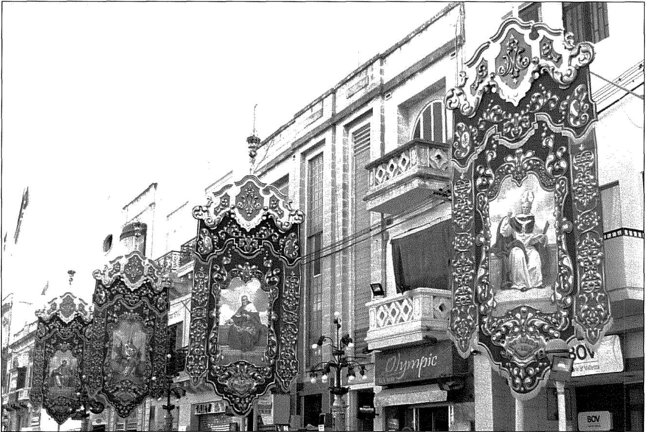
Il-bandalori l-kbar kompluti minn kollox u armati għall-festa tal-2016

Sales meta jgħidilna liema iben ma jqajjimx lil ommu mejta lura għall-hajja u ma jtellagħhiex fil-glorja tal-Ġenna kieku jista' Huwa ċert li l-Mulej Ġesù għamel dan għax il-Mulej stess ma setax ma josservax bl-akbar fedeltà r-raba' kmandament li jordna lill-ulied sabiex iwegġġhu lil missierhom u lil ommhom.