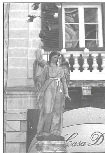
Wieħed mill-angli magħrufin bħala 'tal-kuruna ż-żgħira', li nħadmu minn Vincenzo Cremona.

Jekk imbagħad induru lejn il-kotba tar-Rabta l-Ġdida nsibu li l-angli jissemmew f' diversi episodji ewanġeliċi. Hekk naraw li l-angli huma habbara tat-twelid u l-qawmien ta' Ġesù Kristu, jikkomunikaw ma' San Ġużepp fil-holm sabiex jiproteġu lit-