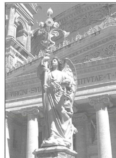
Wieħed mill-angli li nħadmu aktarx minn Karmnu Mallia armat fil-festa tal-Qalb ta' Ġesù ta' din is-sena fl-okkazjoni tal-festi speċjali li saru sabiex ifakkru l-100 sena mill-Kongress Ewkaristiku tal-1913. Ta' kull sena dawn l-angli jintramaw kemm mal-plancier tal-banda fil-festa kif ukoll mas-sepulkrum fil-Ġimgha l-Kbira.