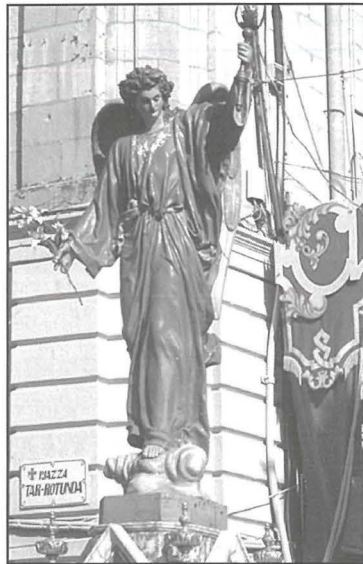
Wieħed mill-angli magħrufin bhala 'tal-kuruna l-kbira', xogħol ta' Karlu Darmanin.