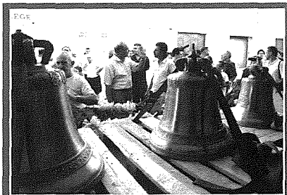
Il-wasta tal-qniepen godda

Issa l-qniepen tal-Matriċi saru jingħarfu wkoll għax tista' tgħid li minn kważi sena l-hawn, meta jindaqqu l-qniepen il-godda, l-hoss huwa melodjuż, ritmiku, sabieħ.