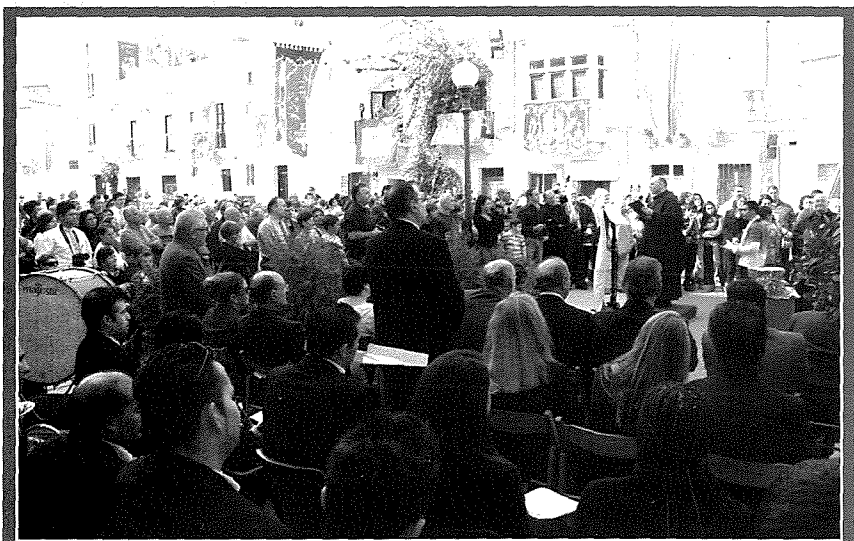
Ċerimonja tat-tluġ tal-qniepen

kwazi lesti. Fil-11 ta' Awwissu il-qniepen il-godda kienu qegħdin fil-port ta' Antwerp fil-Belġju jistennew li jaqbd u triqthom lejn Malta. It-tlieta li huma kienu ppakkjati f-kaxxa tal-injam imfassla apposta. Kien ittammat li jekk kollox kien jimxi ħarir, huma kellhom jaslu f'pajjiżna fis-17 ta' Awwissu 2011. Imma kif jgħidu: Ix-xitan m'għandux ħalib. Minħabba xi maltemp qawwi fl-inħawi, l-vapur ma salpax. Izjed ma kien hemm herqa u mistennija għall-wasla tagħhom, iżjed li donnu l-qlub kellhom jittersu xi ftit iehor! Imma fl-aħħar waslet l-aħħar tant mixtieqa. Fl-aħħar nhar l-24 ta' Awwissu għall-habta tas-2.00pm, il-Pirjol gie mġarrat bit-telefon li l-qniepen kienu waslu Malta. Mal-aħbar il-herqa nbidlet f'entuzjażmu kbir..., eja ħalli ngibuhom mill-aktar fis! Imma l-kaxxa ma setgħetx tithalla mil-Marsa jekk mhux bl-approvazzjoni