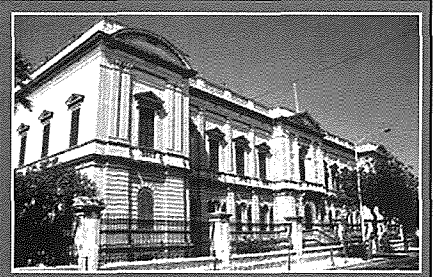
Istituto Tecnico Vincenzo Bugeja

Madankollu, Bugeja kien ukoll filantropu. Ried jara kif bil-gid li kellu seta' jgħin lill-batuti tas-soċjetà. Haseb li tajjeb li johloq konservatorju biex jilqa' fih bniet f'qar iltiema. Wara li talab il-permess għal din l-opra mingħand l-Arċisqof ta' Malta Mons. Gaetano Pace Forno fil-11 ta' Ġunju 1872, dan il-permess wasal erbat ijiem wara. Anki l-Papa Piju IX, waqt udjenza ma' Bugeja, heggu biex ikompli bil-ħsieb li kellu. L-ostakli ma naqsux imma l-ewwel ġebba fl-aħħar tqieghdet nhar l-20 ta' April 1876. Poggietha mart il-Gvernatur Sir Charles Van Straubensee. Beda għalhekk il-bini fuq pjanta tal-