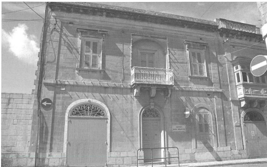
Id-dar li nġhatat biex issir l-Oratorju Marija Immakulata (hajr Parroċċa Mosta)