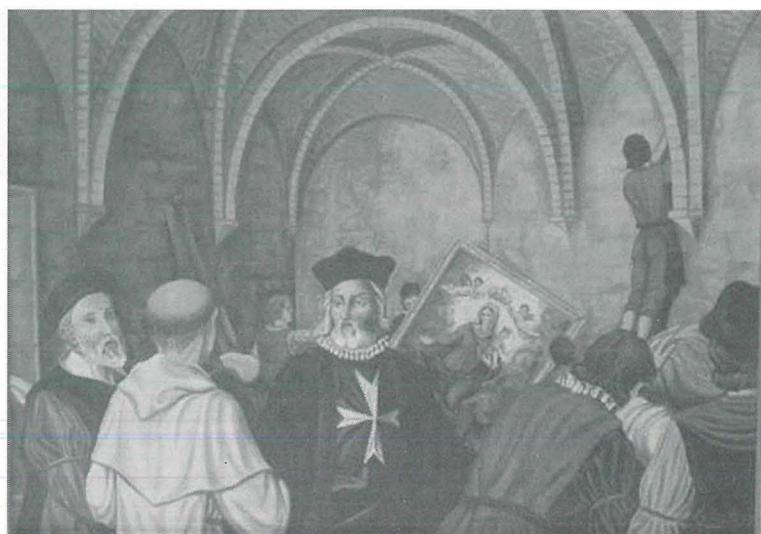
Il-pittura turi lill-Granmastru l'Isle Adam bil-Madonna tal-Grazzja f'idu