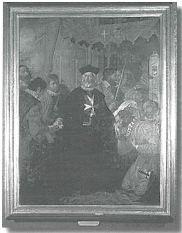
Il-Granmastru L'Isle Adam jieħu l-pussess fl-Imdina

Wara l-quddiesa kulhadd kien jersaq lejn is-salib ta' barra l-Imdina, fejn il-ġurati jipprezentawlu bukkett tal-ganutell kif kienu jagħmlu lill-kbarat li jżuruhom. Il-Gran Mastru kien jimxi taħt baldakkin lejn