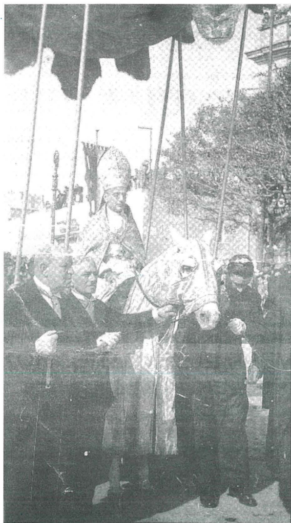
Fir-ritratt għandna epoka li spiċċat għal kollox. Naraw id-dhul solenni ta' l-E.T. Mons. Arcisqof Mikiel Gonzi, fil-belt l-antika ta' l-Imdina. Dan ir-ritratt ittiehed fit-22 ta' Mejju 1944. Nistgħu naraw il-mod kif hu armat iż-żwiemel li fuqu riekeb l-Arcisqof u l-baldakkin fl-gholi.

L-għada telaq mingħand id-Dumnikani bil-karrozzella akkumpanjat minn missieru f'oħra. Quddiemu kien hemm il-kanċillier tal-kurja fuq id-debba bis-salib ta' l-isqof u liebes l-ispellizza. Wara l-isqof imxew id-Dumnikani u l-ekonomu jew teżorier ta' l-isqof. Sadattant nies, qniepen u briju, tiżjin u musketterija kullimkien. Quddiem San Mark laqgħuh l-Agostin