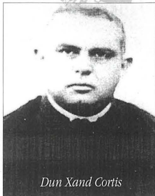
Dun Xand Cortis

Jibqgħu il-kotba tieghek, hemm, b'tifkira: Tal-għerf u mhabbtek safja għal-lsien tagħna: Kont Patrijott u gieħek jibqa' mieghek!