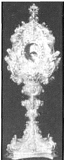
OSTENSORIU TA' RELIKWII TA' SAN PIETRU U SAN PAWL (1915) Ir-Relikwarju li sar fl-1915