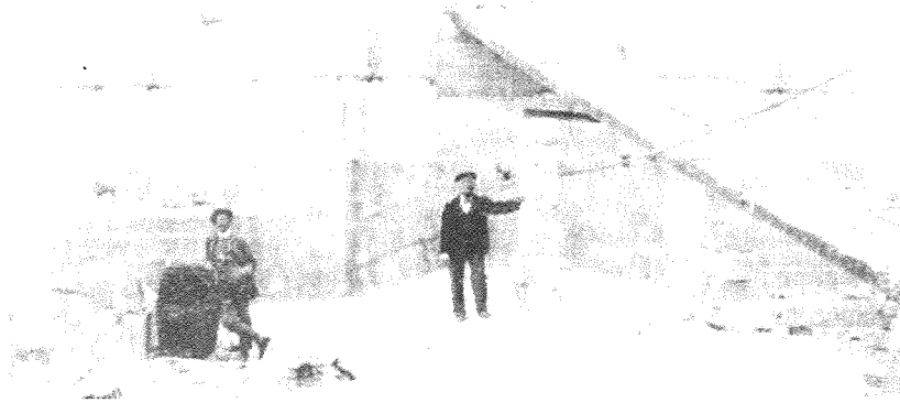
Il-koppla tan-Nadur waqt li qed tinbena

Mhux l-intenzjoni tiegħi li nidhol fid-dettal tax-xogholijiet ta' Sciortino fin-Nadur. Imma xieraq li nispjega x'kienu dawn ix-xogholijiet. Il-koppla tan-Nadur tabilhaqq kienet xi haġa ġdida f'Malta u Ghawdex. Hija koppla originali, mibnija fuq stil rinaxximentali tas-seklu sbatax. Kienet l-ewwel koppla li kisret ir-rekord tan-nofs ċirku. Fi kliem iehor, l-ebda koppla f'pajjiżna ma kienet tiskorri n-nofs ċirku. Tan-Nadur kienet skorrieta. Tabilhaqq hija koppla armonjuza u proporzjonata kemm fit-tul, wisa' fit-twieqi u anke fil-prespettiva tagħha. Anzi, dan kollu għal ftit ma ġiex miġjub fix-xejn. Dun Martin beza li l-knisja tan-Nadur ma kinitx tiflaħ għal dak il-piż ta' koppla bħal dik. Dan kien għajdut reali. Imma Dun Martin kellu l-kuraġġ li jafda f'idejn Sciortino. Tabilhaqq li mnekkiet u