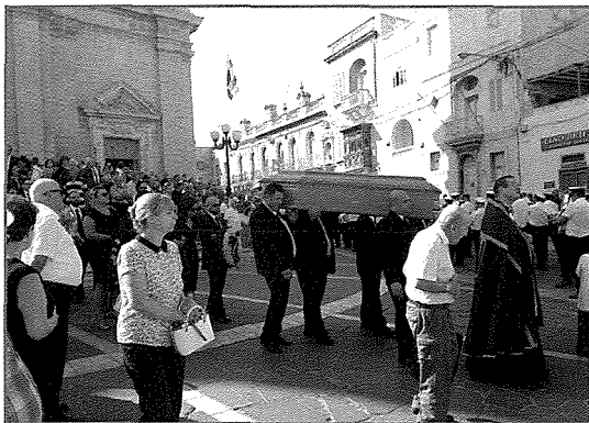
Membri tal-Kumitat Festi Esterni Santa Venera, tul il-korteo