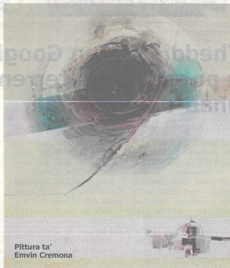
Pittura ta' Emvin Cremona