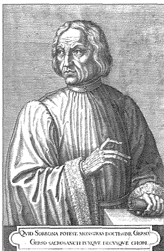
Jean Gerson (1363-1429)

Fl-1621 il-Kapitlu Ġenerali tal-Ordni Karmelitan, għażel lil San Ġuzepp biex ikun patrun u missier tal-Ordni kollu 4 . Fl-1680 il-Vatikan