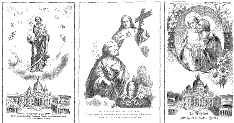
Tliet santi antiki li juru l-Patroċinju ta' San Ġuzepp fuq il-Knisja Universali

It-talbiet tal-prelati li pprezentaw lill-Papa Piju IX fil-Konċilju Vatikan I tal-1869-70; biex San Ġuzepp jiġi ddikjarat solennament Patrun tal-Knisja Kattolika, kienu tlieta fin-numru. L-ewwel petizzjoni, kienet iġġib il-firem ta' 118-il Isqof. It-tieni petizzjoni kienet iffirmata minn 43 Superjuri Ġenerali ta' diversi Ordnijiet Reliġjużi. It-tielet petizzjoni kienet iffirmata minn 256 Kardinali u Isqfijiet.