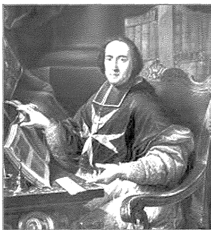
L-Isqof ta' Malta Fra Paolo Alpheran de Bussan (1728-1757)

politici ta' dak iż-żmien, laqa' bil-ferħ f'Jum is-Solennità tal-Immakolata biex San Ġuzepp jiġi proklammat b'mod solenni u uffiċjali Patrun tal-