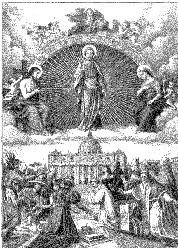
Xena tal-Patroċinju ta' San Ġuzepp fuq il-Knisja Universali

Kien dak id-digriet tat-8 ta' Diċembru 1870 – digriet qasir, iżda grazzjuż u ammirabbli “Urbi et Orbi” verament denn ta’ “Ad perpetuam rei memoram”, li fetaħ vina ta’ ispirazzjonijiet rikki u prezzjużi għas-suċċessuri ta’ Piju IX. Għalhekk dan id-digriet kien aktar minn proklamazzjoni uffċjali ta’ għarfien lejn il-Patroċinju ta’ San Ġuzepp fuq il-Knisja.