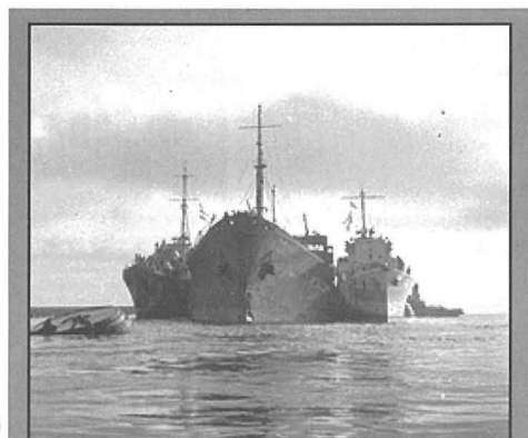
It-tanker SS Ohio marsus bejn id-destroyers HMS Penn u l-HMS Ledbury

Il-ġuħ u l-iskarsezza tal-ikel kienu hekk kbar li jirrakuntaw dawk li għexu dik l-epoka kif hobża kienet tinbiegħ lira meta l-pagi – għal min kien jaħdem – kienu biss f'it xelini! Dan apparti li kolloxx tista' tghid kien jinxtara bil- black market ! Kien hemm min stagħna u stagħna bla skruplu minn fuq dahar il-poplu mġewwah u baqgħu jgawdu wliedhom u wlied uliedhom sal-lum b'negozji mibnijin fuq dak li nsteraq minn halq il-poplu mfaqqar! Izda kien hemm wisq u wisq iktar min