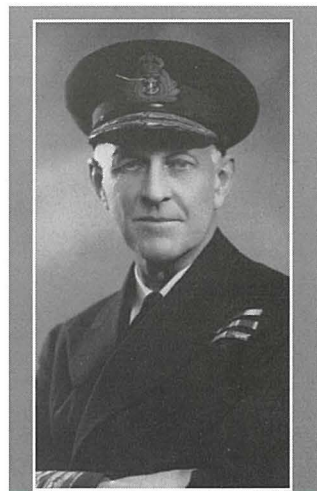
Il-Viċi-Ammirall Sir Edward Neville Syfret, kmandant tal-konvoj ta' Operation Pedestal.

Il-kmandanti militari kienu ddecidew li jekk ma jaslux rifornimenti ta' ikel u żejt, kienu lesti jċedu l-armi u l-gżira ta' Malta. Jingħad li l-ħażniet li kien hawn ma kinux iservu għal aktar minn għaxart'ijiem u kienet anki giet stabbilita data biex iċedu... Dak iż-żmien tant kienet skarsa l-ħażna tad-dqiq li l-familji Maltin kien jħalltuh mal-qxur tal-patata biex jaħmu speci ta' ħobż ismar – l-uniku ikel li kellhom il-Maltin! Izda ma damitx ma skarsat ukoll il-patata u l-ħobż rega' beda jsir abjad izda ferm iktar skars – ħobża tinbiegħ lira!