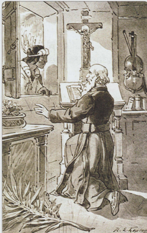
Impressjoni artistika ta' Schmid jitlob għarkupptej bil-ujolin imdendel mal-hajt.

u ġarru f' vjaġġ iebes mimli toroq imħarbtin lejn Santa Ana de Velasco, madwar elf kilometru bogħod mill-belt. Mal-wasla tiegħu f' din il-missjoni maqtugħa għaliha wehidha, Schmid immuntah kollu mill-ġdid