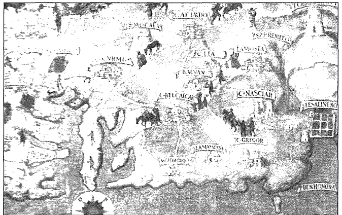
Affreski ta' Matteo Perez D'Alecci dwar l-Assedju l-Kbir fil-Palazz il-Belt. Birkirkara tidher bil-knisja li fuq il-faċċata tagħha hemm kampnar żgħir. Madankollu, mhux bilfors li l-immaġni turi verament kif kienet.