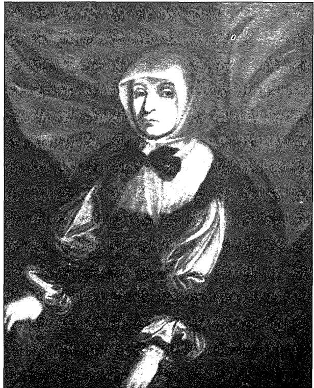
Is-Sinjura Margerita d'Aragona, Fundatriċi tal-Lunzjata l-Qadima. Pittura li tinsab fil-Kunvent ta' l-Imdina.

Bhala l-ewwel dokumenti uffiċċjali li jeżistu hemm l-atti tal-kapitlu provinċjali fejn fost l-ohrajn dawn id-dokumenti juru li sa mis-sena 1452 kienu diġà għażlu il-pirjol u s-sotto pirjol li kellhom jieħdu