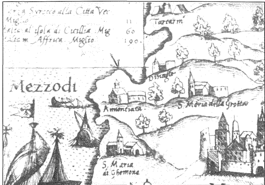
Mappa antika ta' Malta li turi l-knisja u l-kunvent tal-Lunzjata l-Qadima.

ukoll il-Karmelitani tal-Lunzjata l-qadima kienu jqaddsu kemm fil-Knisja ta' S. Katald kif ukoll fil-Katidral l-Imdina.