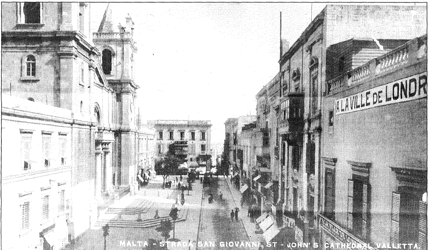
MALTA - STRADA SAN GIOVANNI ST - JOHN'S CATHEDRAL VALLETTA