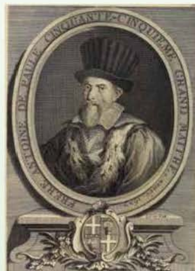
Il-Gran Mastru Antoine de Paule.

art kien ser jingabar qamh u frott ieħor bħalma kien qed isir mill-Università tan-Notabile li wkoll kellha artijiet fl-Aħrax. Dawn l-erba' ġurati tal-Belt Valletta, forsi anke sabiex ikomplu jħajru lill-Gran Mastru, qalu li b'din l-għotja l-poplu kien ser ikun obligat jitlob għas-saħħa u l-kobor tiegħu. Fit-2 ta' Ġunju 1633, xahar