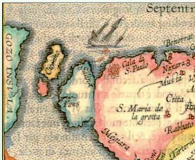
Parti mill-mappa ta' Malta. A. Ortelius/J.B. Vrients. Malta Olim Melita. 1602.p.