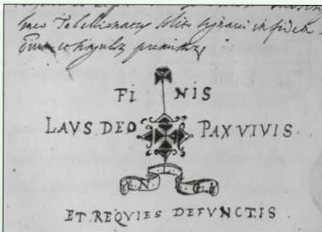
Parti mid-dokument tal-1633.

L-għoti ta' art pubblika kien spiss iwassal għal kwistjonijiet u kien hemm min jipprova japprofitta ruħu billi jokkupa art b'mod illegali. FI-1636, il-Gran Mastru Lascaris ħareġ liġi kontra dawn tal-aħħar u tahom ċans li jerġgħu jgibu l-art għall-istat originali u jwaqqgħu l-kmamar bla saqaf li seta' kien hemm.