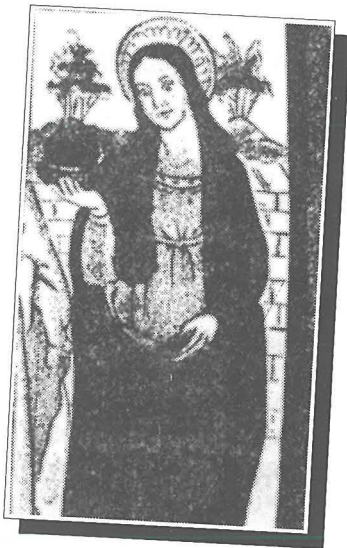
Xbieha ta' Santa Venera V.M., aktarx tas-seklu III, li tinsab fil-Katakombi ta' Sant'Agata, ir-Rabat Malta.

Tradizzjoni antika tghidilna li Santa Venera kienet ġiet Malta flimkien ma' Sant'Agata, u li dawn it-tnejn għamlu xi zmien jghixu fil-Katakombi ta' Sant'Agata fir-Rabat Malta. Fl-apside tal-katakombi nsibu diversi affreski u wieħed minnhom huwa dak li jirrappreżenta lil Sant'Agata, Santa Luċija u Santa Venera. Meta din il-pittura ġiet restawrata fl-1881 bi żball ġie mnizzel li x-xbieha ta' Santa Venera hija Sant'Agnese. F'idejn Santa Venera naraw