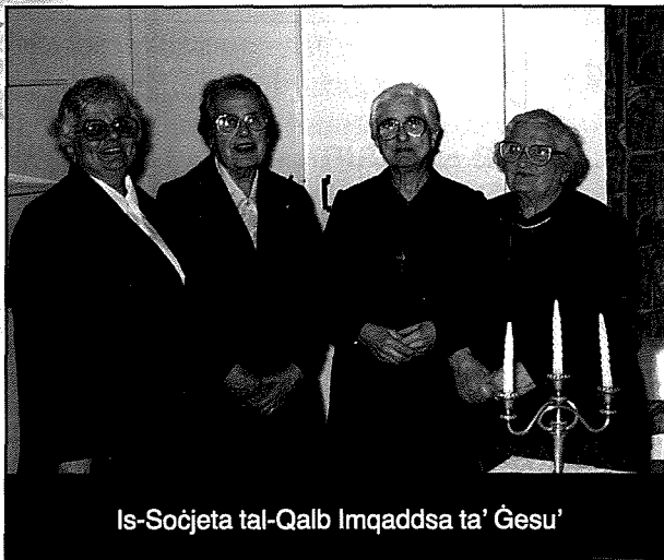
Is-Socjeta tal-Qalb Imqaddsa ta' Gesu'

Il-fundatrici taghna, Santa Madalena Sofija Barat, twieldet f'Dicembru 1779 fil-belt zghira ta' Joigny, Franza. Barra li kienet umli hafna, kellha qalb kbira u Alla zejjinha wkoll bid-don ta' l-intelligenza u l-kapacita' li tgħarbel il-verita, kwalitajiet li tant kellha bzonn fil-pozizzjoni taghha ta' fundatrici. Kienet tifhem, tagħder thobb u tapprezza kull persuna, hekk kienet taf tohrog it-tajjeb min kulhadd.