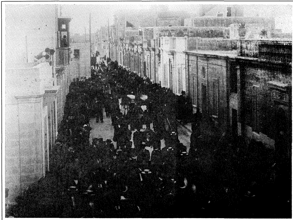
Ritratt ta' funeral ta' vittma ieħor għaddej minn Triq San Girgor lejn iċ-ċimiterju ta' San Girgor għad-difna. Il-Banda Beland tidher fuq quddiem akkumpanjata minn folla ta' nies.

Fl-aħħarnett issa illi għandna l-kunsil Lokali nixtieq nissuġġerixxu illi tissemma triq bhala tifkira ta' dawn il-hames vittmi ta' 90 sena ilu.