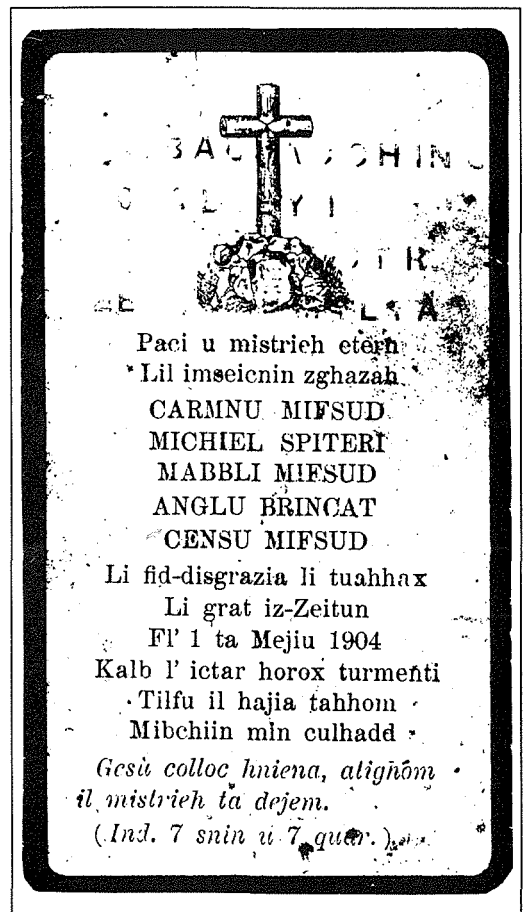
Santa tifkira tal-hames vittmi li mietu fit-tragedja.

bhas-soltu numru mhux hażin ta' dilettranti ingabru biex ikomplu bix-xoġħol tagħhom. Hafna minnhom hekk kif daqqet il-quddies ta' l-10:00 am telqu lejn il-knisja biex jjsimġhu l-quddies filwaqt illi sitt żgħażaġħ baqgħu fil-kamra jaħdmu. Kien għal haħta ta' l-10:30 am meta splużżjoni qawwija regħdet lir-raħal. Kienet taret il-kamra tan-nar u ndarbu sejament dawk is-sitt żgħażaġħ illi kienu hemm ġew. Dawn kienu: