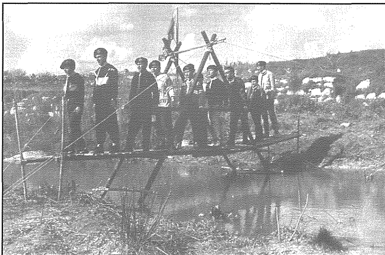
Scouts Mostin g'addejin minn fuq pont li bnew huma stess fuq Wied il-Qlejja

L-Address hu:- Bury Road Chingford, London E4 7QM. Dan qiegħed f'Epping Forest. Dan il-Park hu post ta' tahrig għall-kapijiet ta' l-iscouts, u anke post fejn jikkampjaw Scouts minn diversi pajjiżi minn madwar id-dinja. Dan il post fih swimming pool, store, sptar zghir u scout shop. L-ewwel course tal-Wood Badge inżamm f'dan il-Park fl-1919.