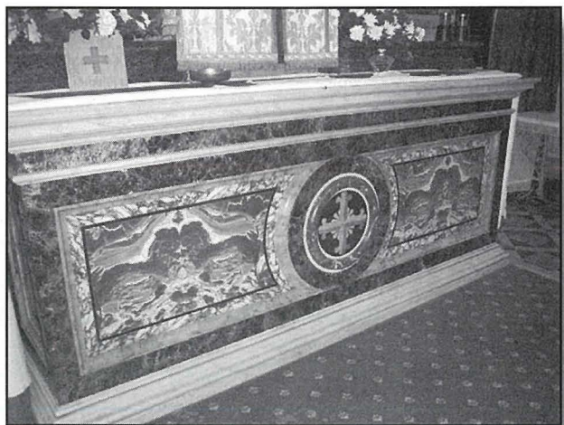
Mensa tal-Artal Maġġur

Wara, l-Isqof ġie mlibbes l- Abiti Sagri u bierek l-ilma. Eżatt wara bdiet iċ-ċerimonja tat-tberik tal-ħitan tal-knisja sew min-naħa ta' ġewwa u sew min-naħa ta' barra filwaqt li żewġ saċerdoti xarbu bl-ilma mbierek il-ġnub tal-bieb il-kbir tal-knisja. Meta l-Isqof spiċċa mit-tberik tal-ħitan tal-knisja ġie mxxerred l-irmied mal-art f'forma ta' Salib ta' Sant'Andrija, għadda l-Isqof minn fuqu u bil-baklu ħażżeż l-ittri Alpha u Omega fuq l-erbgħa dirgħajn tas-Salib, li jfissru li Kristu huwa l-bidu