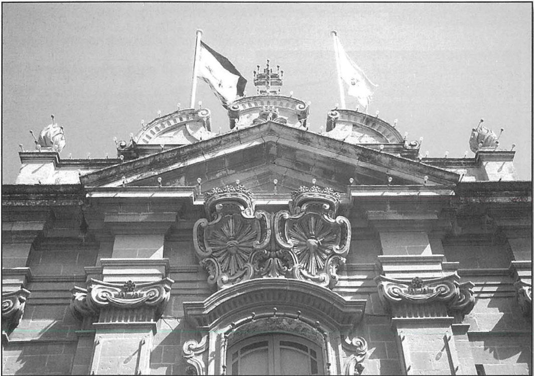
Il-Knisja minn barra