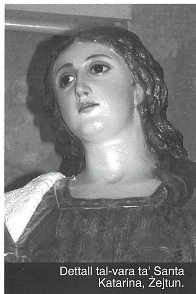
Dettall tal-vara ta' Santa Katarina, Żejtun.

L-istatwa titulari taż-Żejtun ilha għal dawn l-aħħar snin opra xi ftit misterjuża. Kien jinghad li nħadmet fi Spanja lejn tmiem is-seklu dsatax. (1) It-tradizzjoni li ngiebet minn Spanja giet kwotata minn bosta awturi li kitbu fuq din ix-xbiha. (2) Kien għe wkoll stabbilit li l-ikonografija tagħha kellha tabilhaqq elementi Spanjoli interessanti. (3) Fl-edizzjoni ta' l-2003 ta' dan l-fuljett kien deher artiklu li fih għet