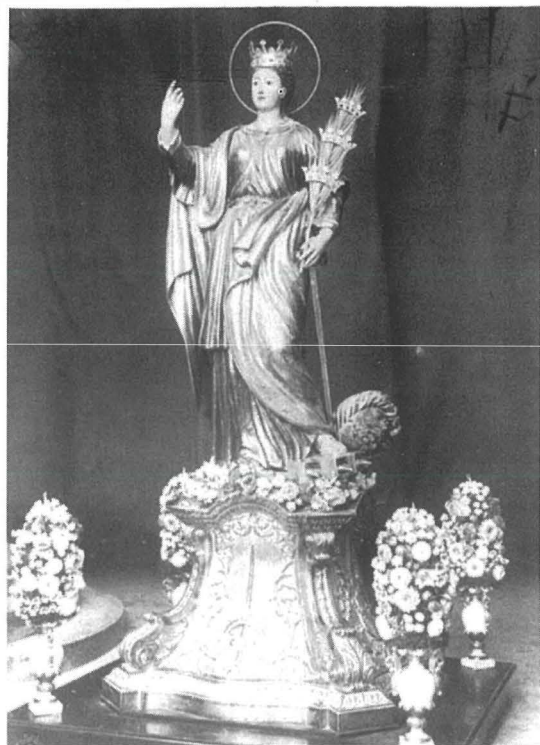
L-Vara titolari ta' Santa Katarina, Żejtun qabel l-intervent tal-1928.