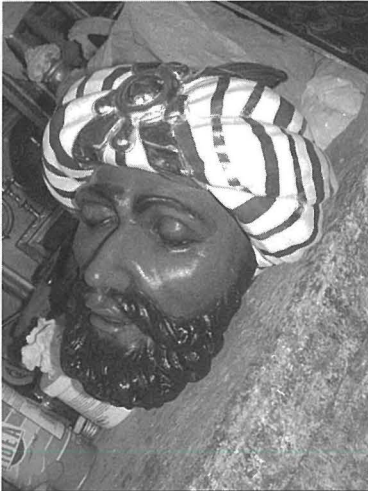
Dettall tar-ras ta' Massiminu, Statwa ta' Santa Katarina, Żejtun.

1745 biex jitharreg fl-arti tal-iskultura iżda ftit li xejn huwa maghruf dwar