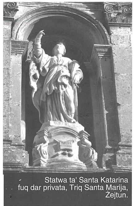
Statwa ta' Santa Katarina fuq dar privata, Triq Santa Marija, Żejtun.