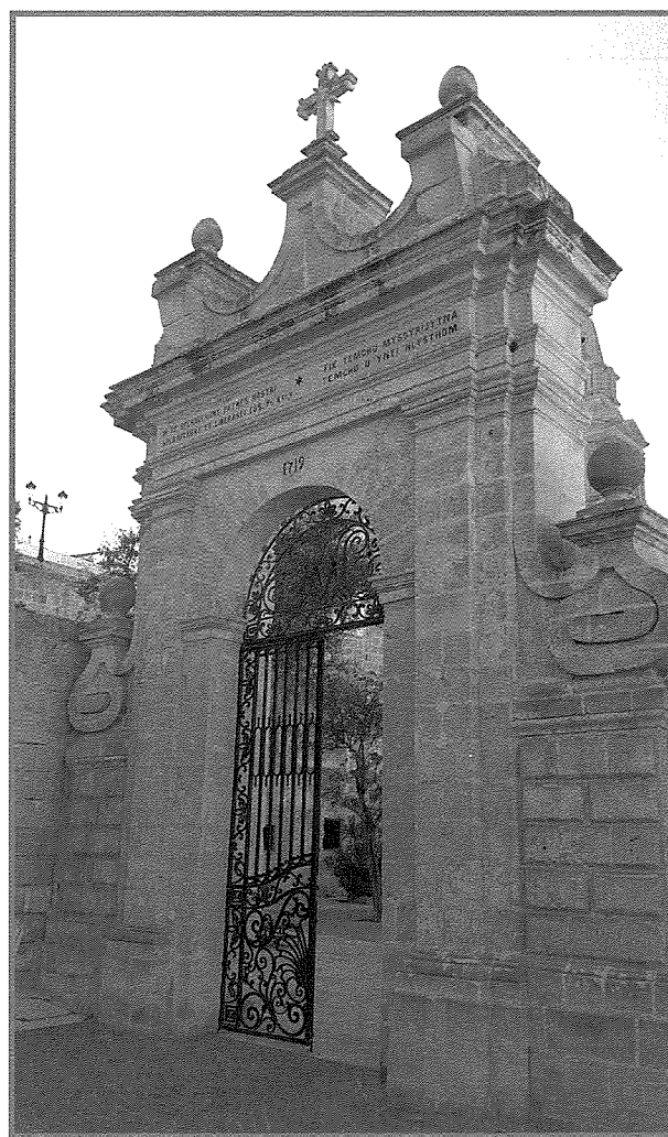
L-Ark Trijonfali fid-dahla għall-bitha tas-Santwarju

F'Malta fi żmien il-Kavallieri ta' San Ġwann, inbnew għadd ta' arki trijonfali, ngħidu aħna, ta' Wignacourt (1615), De Rohan (1798) u Hompesch (1801). L-ewwel ark inbena bħala tifikira tal-akwadott u t-tnejn l-oħra biex ifakkru t-twaqqif tal-ibliet ta' Haż-Żebbuġ u Haż-Żabbar mill-gran mastri msemija rispettivi. Ftut wara l-bini tal-ark tal-bitha tas-Santwarju, fl-1720-21 inbena dak li llum nafuh 'Bieb il-Bombi' u li dak iż-żmien kien jissejjaħ Porta dei Cannoni . Bieb il-Bombi ma kienx ark trijonfali kif jidher illum u kien fih biss mina waħda. Kien jiffirma parti mis-Swar tal-