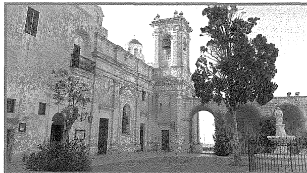
Is-Santwarju Nazzjonali tal-Madonna tal-Mellieħa

Mal-għbir imsemmi, sors ewlieni ta' dhul, li għen biex jithallsu l-ispejjeż tax-xogħol li sar lis-Santwarju u l-binjiet ta' madwaru kienu d-diversi donazzjonijiet oħra li taw kavallieri u kaptani ta' xwieni u iġfna tal-Ordni u tal-kursara Maltin. Fl-1700 il-Gran Mastru Perellos irriforma l-flotta tal-Ordni. Minn tmien xwieni, il-flotta tal-Ordni niżżilha għal ħamsa u magħha ħoloq skwadra oħra ta' erba' vaxxelli. Ir-riforma tat il-frott għax permezz tal-ħbit bil-vaxxelli u bċejjeċ tal-baħar oħra nqabdu għadd ta' prejjeż, fosthom frejgati, vaxxelli, tartani u bastimenti oħra tal-gwerra u merkantili, l-aktar Tuneżini, Alġerini u Torok 12 , u minn dan il-ġid ibbenifikaw bosta opri artistici, binjiet militari u postijiet reliġjużi bħas-Santwarju tal-Madonna tal-Mellieħa.