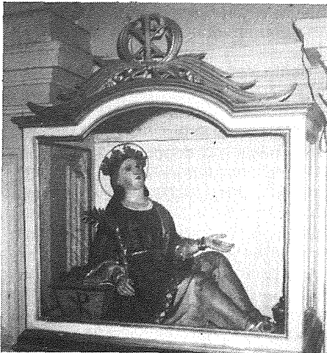
Ritratt li juri statwa ta' Relikwarju ta' Santa Venera V.M. fil-Monasteru tas-Sorijiet tal-Klawnsura fil-Birgu.