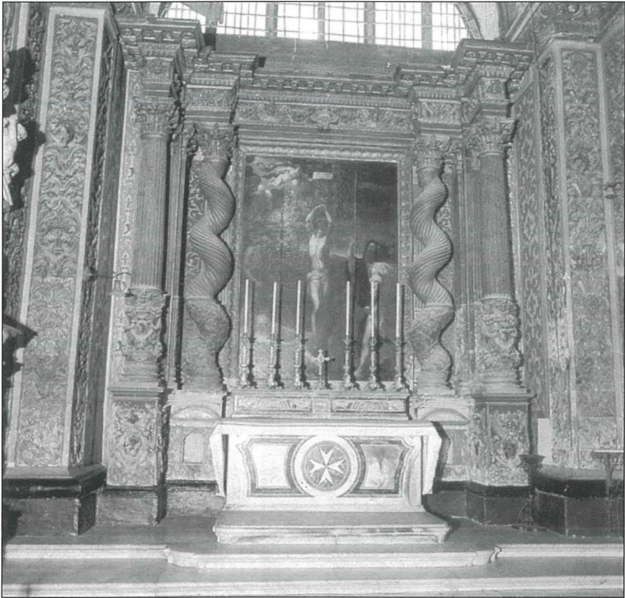
Il-kappella ddedikata lil San Sebastjan

It-tieni kappella 1 li nsibu fuq in-naħa ta' l-epistola ta' l-altar maġġur, hija dik iddedikata lil San Bastjan. Din il-kappella kienet tappartjeni lil-Lingwa ta' Alvernja, reġjun fi Franza. 2 Bhal kull kappella ohra f'din il-knisja, anke f'din hemm diversi dekorazzjonijiet li jfakkru lil dak li jkun fiż-żmien l-Ordni ta' San Ġwann. Izda l-ghan ta' din il-kitba m'hijiex biex niddeskrivu l-