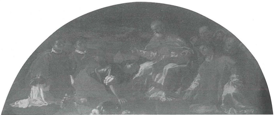
Pittura ta' Giuseppe d'Arena fil-kappella ta' San Sebastjan li turi lill-qaddis quddiem il-papa

Il-paviment tal-Kappella ta' San Bastjan hija mzejna b'numru ta' lapidi li jfakkru kavallieri. Fost dawn insibu l-Kavallier Fra Jean de La Baume de