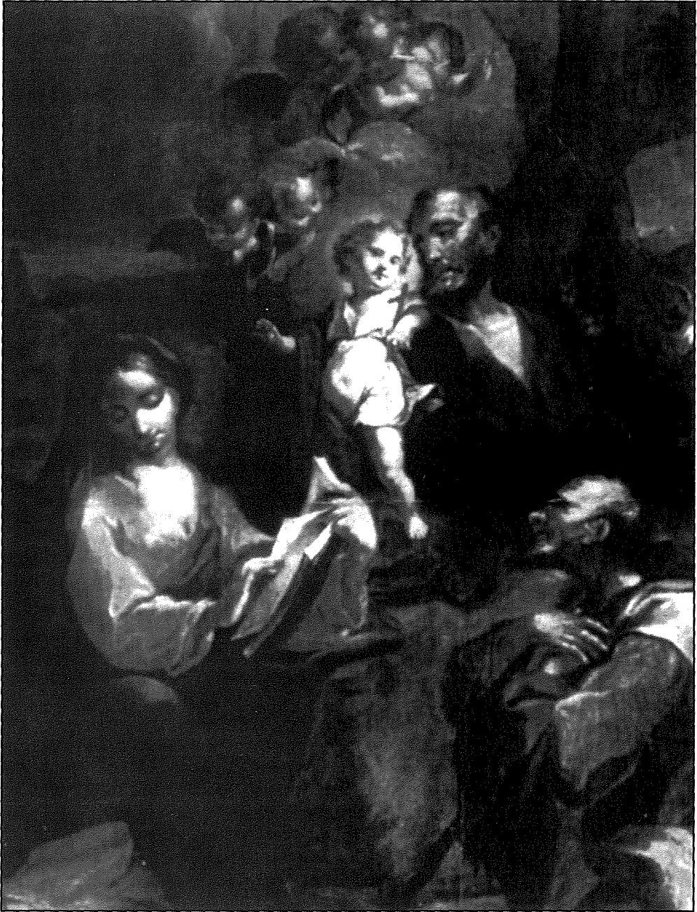
Kwadru li juri s-Sagra Familja, fil-Kolleggjata ta' San Pawl gewwa r-Rabat - Malta.