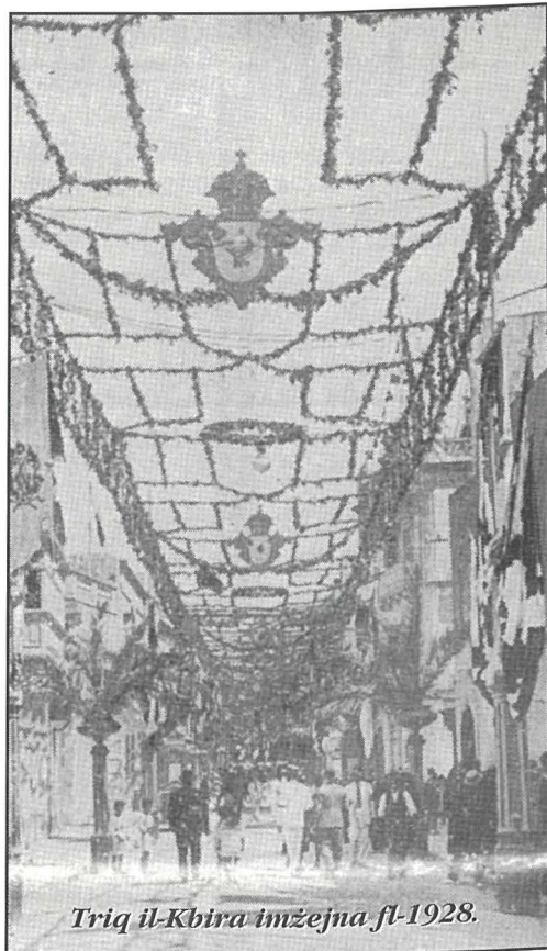
Triq il-Kbira imżejna fl-1928.