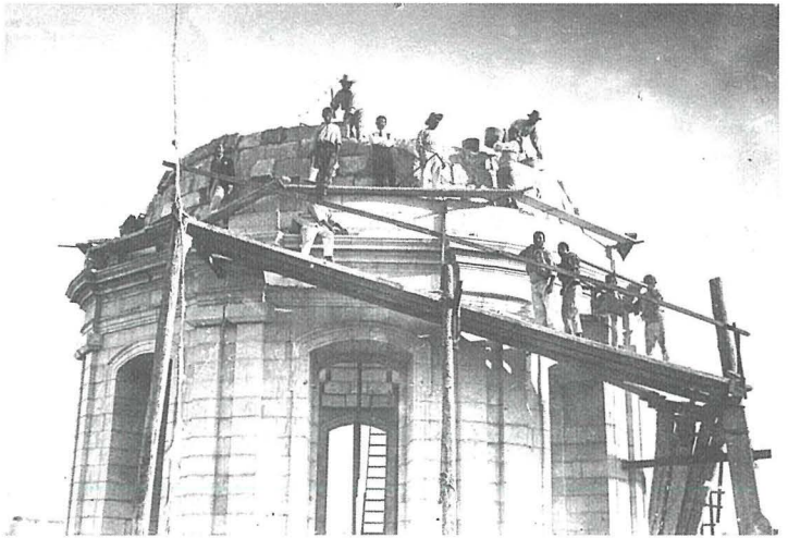
Il-koppla li ħallas għaliha minn butu l-Arċip Vella.

Hija tassew ħasra li ma għandna xejn xi jfakkarna f'dan l-Arċipriet żelanti u benefattur illustri tal-parroċċa tagħna. Mank biss ma semmejna triq għalih, fejn imbagħad insibu ismijiet ta' toroq strambi u bla sens. Arċipriet Vella altru li jixraqlek, imma aħna perswaži li Santa Margerita li inti kont tant tħobb bil-fatti u mhux bil-kliem ħaditek biex tgawdi magħha lil Alla għal dejjem.