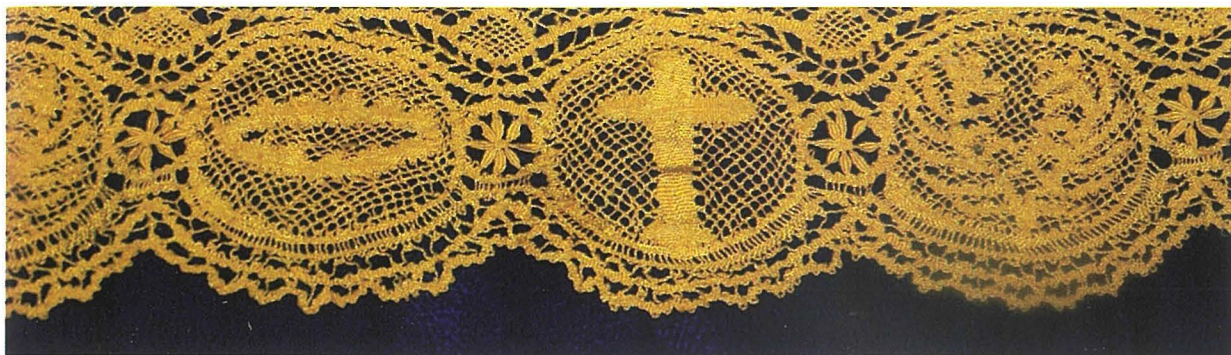
Terha tal-altar tal-kor. Fiha s-simboli ta' Santa Margerita; kuruna, salib, palma u ġiljuwa.