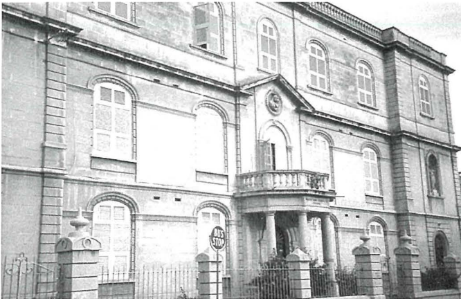
L-iskola tas-Sorijiet Mater Boni Consilii ta' Raħal Ġdid li fl-ewwel jiem tal-gwerra serviet bħala sptar.

koroh. Għal dan l-iskop inkrew għadd ta' djar privati mill-awtoritajiet tal-edukazzjoni. Djar li kienu jkunu qrib xi xelter biex f'każ ta' attakk mill-ajru l-istudenti u l-għalliema jkunu jistgħu jidhlu jistkennu fih fl-iqsar ħin possibbli. Fil-Log Book tal-iskola Primarja ta' Raħal Ġdid li jkopri l-perjodu mill-1930 sal-1954 hemm miktub li f'Settembru tal-1940 l-iskola kienet tikkonsisti f'dawn il-klassijiet: Stds 1, 2 u