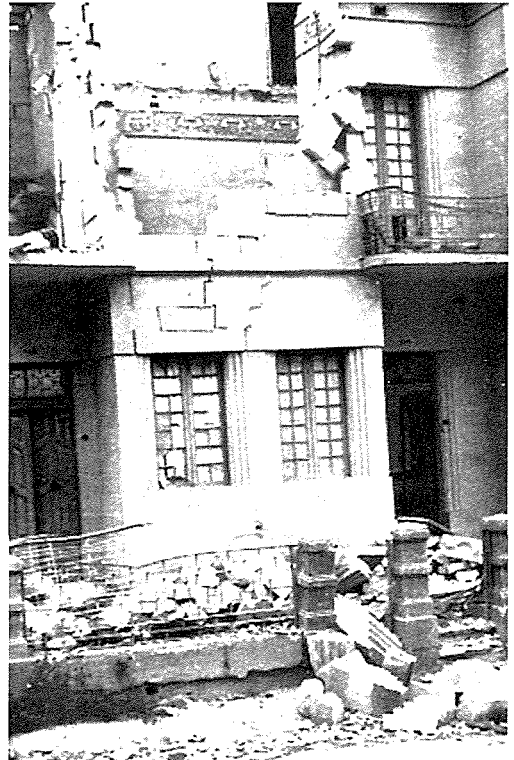
Dar imġarrfa f' attack mill-ajru fi Triq Ħaż-Żabbar Raħal Ġdid. Fi djar bħal din fl-istess triq kienu jingħataw it-tagħlim l-istudenti ta' dawn l-inħawi fit-tieni gwerra dinjija.

Xi wħud mid-djar li ntużaw bħala klassijiet għat-tagħlim fi żmien l-aħħar gwerra dinjija f' Raħal Ġdid kienu dawk enumerati 7 u 14 fi Triq Ħaż-Żabbar, u dawk bin-numri 61, 72, 73 u 74 fi Triq Palma. Fi Triq Pawla-Tarxien inkriet id-dar bin-numru 109 u fi Triq il-Karmnu dik nin-numru 25. Intużat ukoll bħala klassi dar li kienet iġġib in-numru 33 fi Triq l-Arkata li illum hi l-qasam tas-Socjetà tad-Duttrina, il-MUSEUM. It-tagħlim kollu kien isir fuq sistema msejjaħ half-time minħabba l-għadd kbir ta' studenti. Għaldastant kien hemm student li jattendu għal-lezzjonijiet fil-ġhodu u oħrajn wara nofsinhar.