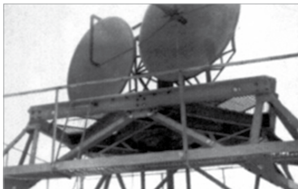
Ir-radar tal-Fortizza Campbell.

Campbell kienet mgħammra b'radar qawwi li kien kapaċi juri fuq l- iscreen tiegħu l-bicċiet tal-baħar minn Għawdex sal-Port il-Kbir, anke bil-lejl. Ta' min ifakkar li madwar il-fortizza kien hemm is- searchlights li setgħu jdawlu l-baħar halli jikxfu l-vapuri tal-għadu li kienu fil-qrib. Il-qawwa ta' dan ir- radar kienet twaqqaf l-arloġġi tal-idejn tas-soldati kif ukoll dawk li kienu mdendlin mal-ħitan fil-bini tal-fortizza. Allura s-soldati li kien għaddielhom ix-xift kienu jindunaw li kien sar il-ħin meta jaraw lil shabhom ġejjin jibdluhom.