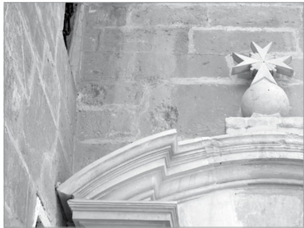
Żewġ marki tal-balal 20mm fuq il-kappella tal-Palazz. Dawn ġew sparati minn ME 109. Balla oħra laqtet il-pittura ġol-kappella.

Jista' ikun li rapport li sar nhar 24 ta' Marzu, 1942, li fil-Palazz ta' Selmun u fil-kappella kienu