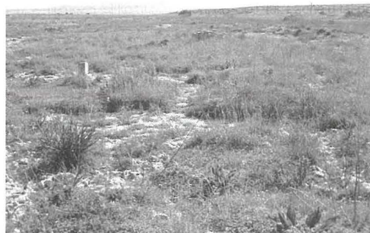
Ix-xagħri f'Ta' Ċenċ.

Sultana, J.(editur). 1995. Flora u Fawna ta' Malta . Dipartiment għall-Harsien ta' l-Ambjent, Malta.