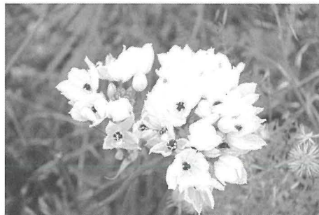
Halib it-Tajr li jfewwaħ u jbajjad qalb il-blat.

F'din il-Ħarġa, dan l-artiklu juri li Ta' Ċenċ huwa importanti mhux biss għall-għasafar iżda wkoll għall-diversi speċi ta' fauna u flora. Ta' Ċenċ , inkluż Wied Sabbara , huwa sit ta' importanza ekoloġika; ġnien naturali ta' xagħri u steppa l-iżjed importanti f'Għawdex. Ix-xagħri huwa ekosistema ta' veġetazzjoni li titkattar l-iżjed fejn ikun hemm wesgħat u pjanuri ta' blat tal-qawwi jew taż-żonqor b'ħafna ħofor u xquq. Hawn jinstabu arbuxelli żgħar, baxxi u folti, li l-biċċa l-kbira minnhom ikollhom riha aromatika bħas- Saghtar , l- Erika , u t- Te Sqalli . F' Ta' Ċenċ u l-inħawi tiegħu jinstabu diversi tipi ta' xagħri, fejn fuħud jiddominaw ċerti pjanti bħaż- Żebbuġa , u f'oħrajn jiddominaw pjanti oħra bħat- Tengħud tax-Xagħri . Fl-imghoddi partijiet mill-inħawi f' Ta' Ċenċ , kienu jinħadmu. Iżda illum huma żdingati u b'hekk żvilluppat l- Isteppa , ekosistema oħra ta' veġetazzjoni fejn jinstabu pjanti erbaċċi speċjalment dawk tal-familji slavaġ bħal taz-zunnarija (eżempju: Zunnarija tal-Baħar ), kif ukoll pjanti bil-basal jew tuber, bħall- Għansar u l- Berwieq . Dawn il-pjanti slavaġ li semmejt flimkien ma oħrajn bħalma huma l- Orkidej , il- Halib it-Tajr , in- Narċiż , il- Bezzulet il-Baqra , il- Fejġel , u ħafna u ħafna oħrajn, jiffurmaw ġnien xagħri estensiv, partikolarment fix-xitwa u r-rebbiegħa. Dawn il-pjanti kollha joffru