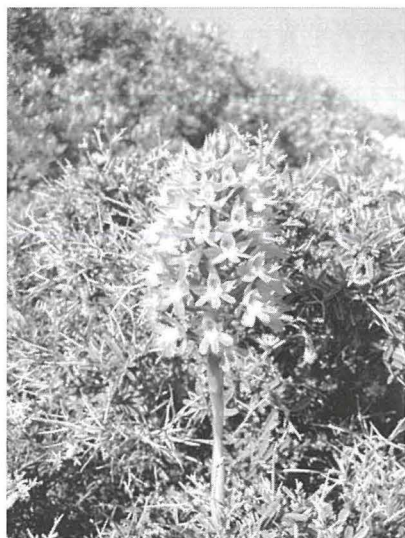
Orkida Piramidali li thammar fil-blat tax-xagħri.

inhawi f'Ta' Ċenċ hija addattata għall-hajja tagħhom. It-tlieta johorġu jilagħqu x-xemx partikolarment fir-rebbiegħa meta x-xemx tkun għadha ma bdiex tikwi ħafna. Sfortunatament hawn ħafna li jistmerru r-rettili. Imma dawn huma annimali bħal oħrajn u jiffurmaw parti mill-ekosistema li jgħixu fiha; ħolqa importanti minn katina naturali.