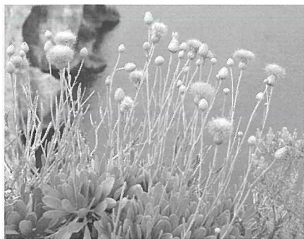
Widnet il-Baħar il-Pjanta Nazzjonali li f'Għawdex tikber f'Ta' Ċenċ.

kenn u ikel lil diversi speċi ta' friefet u insetti li f' Ta' Ċenċ għandhom fejn jirgħaw u jimirfu.