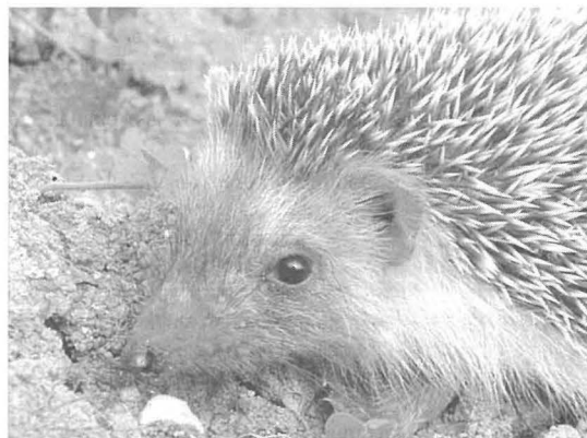
Il-Qanfud mammiferu li għandu xagħru forma ta' xewk iebes.

Fihom jgħixu krustaċej żgħar bħall-gambli u żaġhrun tal-ġhadajjar ta' l-ilma helu. Dawn il-hlejjaq ibidu l-bajd u meta l-ġhadajjar jinxfu l-bajd kapaċi jiflaħ għas-shana u l-qilla tax-xemx fis-sajf, biex hekk fiit wara l-ewwel xita jfaqqas u jerga' jibda ċiklu ieħor fil-hajja tagħhom. Il-Gambli tal-Ġhadajjar fih biss tliet ċentimetri u jinstab fl-ġhadajjar minn Settembru sa April, l-iżjed sa Mejju. Ikun kannella ċar kemxejn trasparenti, iżda ġieli jkollu lwien oħra jekk ikun għadu kemm kiel xi algi mikroskopiċi. Għandu h̄dax-il par saqajn biex jaqdef u jgħum wiċċu 'l fuq. Il-mara għandha borża kulurita li żżomm il-bajd fiha qabel tbidhom.