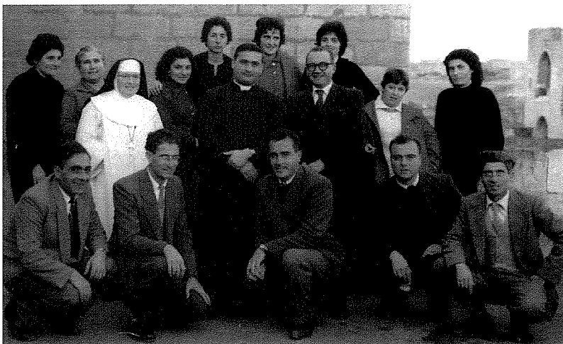
Ġanninu t-tieni wieħed mill-lemin