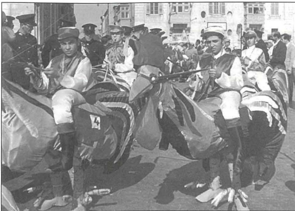
Ġorġ mal-Ġerejja fuq is-Sriedak tal-Harmonica