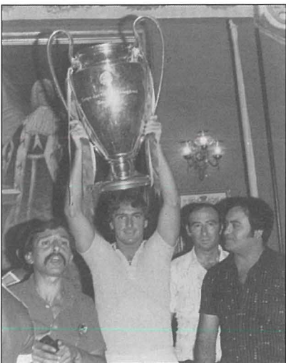
It-Tazza ta' Champions u Trevor Francis fil-Każin tas-Socjeta'

Niftakar meta l-Każin kien ikkompetat fil-Karnival bil-band Harmonica bl-isem ta' "Merry Cock Riders" (Ġerejja fuq is-Sriedak).