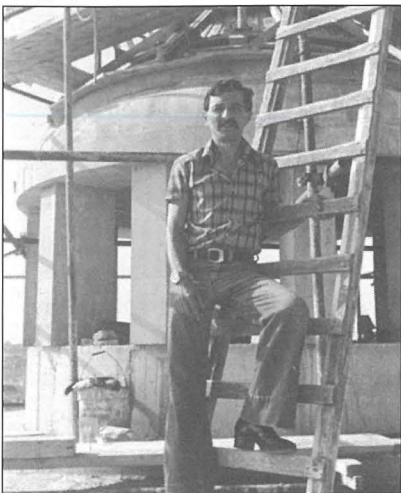
Ġorġ fuq il-koppla tal-knisja