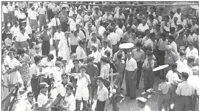
Marċ fil-festa Bastjaniza fl-1955

“Ommi u missieri, kienu l-unika koppja s’issa li għamlu r-riċeviment tat-tieg ġewwa l-każin!”