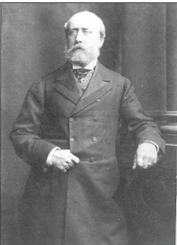
Il-Gvernatur Fredrick Ponsonby