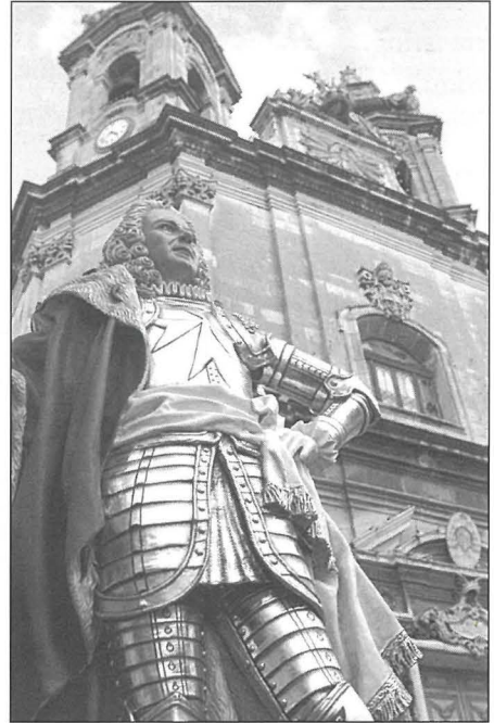
L-istatwa ta' Pinto, xogħol Cutajar Zabna

“Fl-1765 il-Gran Mastru Pinto llitika mal-Inkwizitur għax skjavi minn tiegħu ħarbu u marru jieħdu kenn il-Birgu bl-iskuża li riedu jsiru Nsara.”