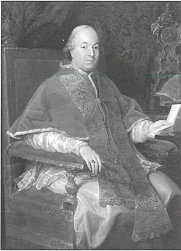
Papa Piju VI