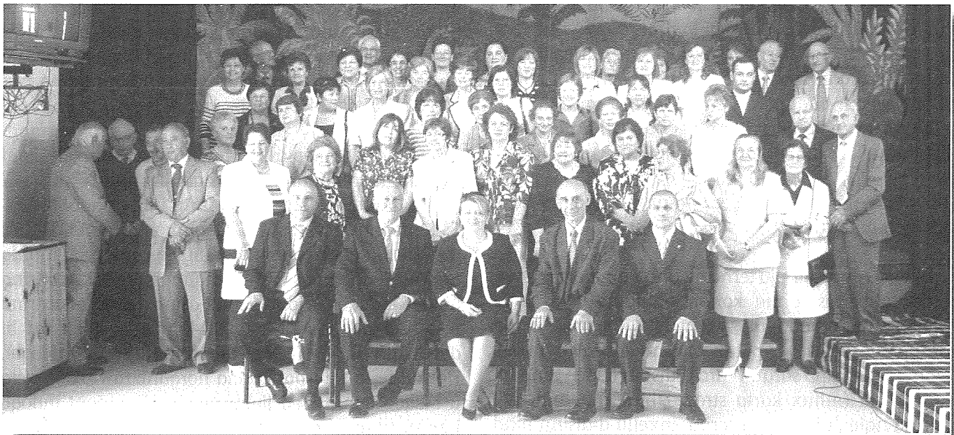
Xi edukaturi u persuni li hadmu fl-iskejjel 'A' u 'B' matul is-snin, hafna minnhom Żwieten. Hajr lis-sur J Galea Kap Skola B.