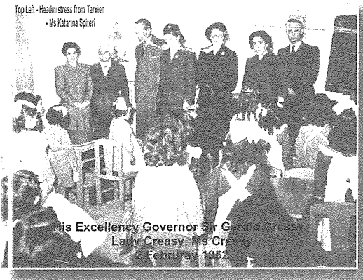
Il-Gvernatur Sir Gerald Creasy

Matul iż-żminijiet l-iskola ma baqgħetx Girls' u Boys' School fit-taqsimijiet tagħha. Għaddiet fażijiet fejn iż-żgħar kienu fis-sular t'isfel u l-kbar fis-sular ta' fuq.