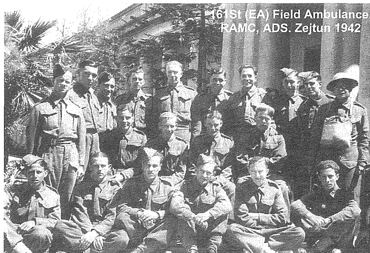
Ritratt meħud fi-żmien il-gwerra. It-tielet wiehed fix-xellug fl-ewwel ringiela hu sur-Cassar li it-tifel tiegħu illum jgħallew fl-istess skola

bdew jgħajtu f'paniku shiħ. Ġriet xniegħa li xi hadd mill-bniet ra x-xitan. Il-bniet tahom esterizmu u hadd ma seta' jikkalmahom. L-aħbar ġriet bħal-lehha ta' berqa u f'tebqa t'għajn hafna ġenituri ġew jiġbru l-bniet mill-iskola. Dan l-incident kien issemma wkoll fuq ir-Rediffusion.