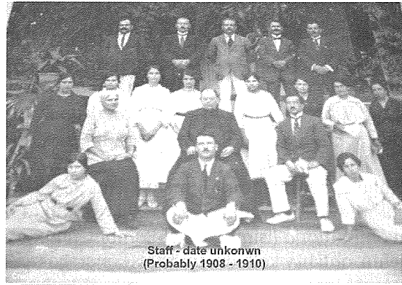
Skola Primarja Żejtun Staff 1908 1910

L-iskola kemm jekk hija kbira jew żgħira hija kbira u sabiħa biss jekk it-tfal jiġu u jmorru lura d-dar ferħanin u kuntenti. Grazi Mulej ta' din il-missjoni qaddisa li afdajt f'idejna l-għalliema.