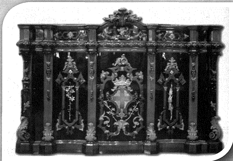
Bradella u Bankun ta' S.Katarina (1909)

It-tradizzjoni ta' bradelli artistiki fil-parroċċa taż-Żejtun tmur 'l bogħod fiż-żmien. Kien hawn mastrudaxxi-mghallmin li b'imħabba kbira lejn l-arti tagħhom, u anki biex joffru l-aħjar u l-isbaħ lil Dak li jemmu fih, hallex warajhom xogħolijiet mill-aqwa li wiehed għadu jista' jammirhom. Jispikkaw f'dawn il-ġranet il-bradella u l-bankun taħt l-istatwa titulari ta' Santa Katarina.