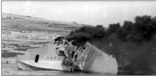
Is-Sunderland L2164 jaqbad, fejn anki nqaghlet u waqgħet il-gwejnħa tax-xellug.

Tuffieħa probabbilment ittieħed matul dawn is-snin. 8 Il- Flight inbidlet fi skwadra f'Jannar 1929 u b'hekk saret tissejjaħ No.202 Squadron tal-RAF. F'Lulju 1932 l-iskwadra rċiviet l-ewwel Fairey III F.Mk.3M. Kif jindika dan ir-ritratt tal-Fairey III F.Mk.3 meħud fil-Bajja tal-Mistra, probabbilment ittieħed fil-bidu tas-snin tletin. 9