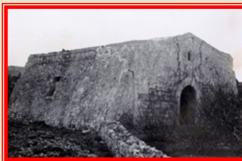
San Mikiel is-Sanċir