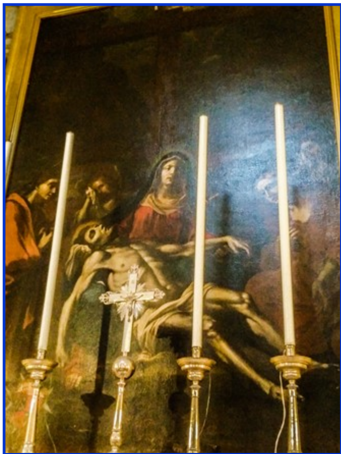
Titular: Madonna tad-Duluri