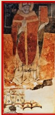
Affresk fil-Lunzjata ta' Hal Millieri (Rit M Morana)

il-kappella juru wkoll li l-qaddisin meqjuma dak iż-żmien f'Malta kienu l-istess bħal dawk meqjuma fi Sqallija tal-Lvant fejn il-Kristjaneżmu kien ta' rit Bizantin.