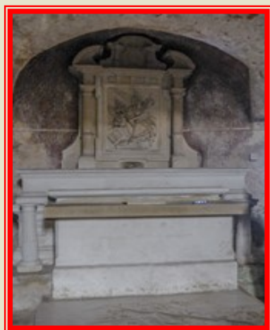
Kappella taħt l-art, Santa Marija Madalena, In-Niedma, fir-Rabat, maġenb il-knisja ta' San Pawl

L-eqdem kappelli f'Malta, almenu dawk li nafu bihom illum, imorru lura sas-seklu tlettax / erbatax. Dawn bdew jinbew wara l-perijodu Għarbi (u miegħu dak Musulman), meta bdew jaslu l-ħakkiema l-ġodda, bħan-Normanni (1127), l-Isvevi (1195), l-Anġevini (1266) u warajhom l-Aragonizi (1282), li kollha ġew minn Sqallija. Dawn l-ewwel ma għamlu bnew il-kappelli għalihom infushom, fil-, u barra l-Kastell Sant Anġlu, fil-Birgu. Fl-istess waqt dawk li kienu jamministraw lill-Malta mill-Imdina, barranin ukoll, għamlu l-istess. Fis-seklu tlettax, il-Katidral, li sa dak iż-żmien kien qisu parroċċa, kien l-akbar f'Malta fl-istruttura u fl-importanza fost il-knejjes kollha. Minħabba li l-Imdina kienet il-Belt kapitali din saret il-knisja li kienet tirrappreżenta l-Isqof ta' Malta, li kien jamministra lill-Malta minn Sqallija bħala parti mid-djoċesi tiegħu.