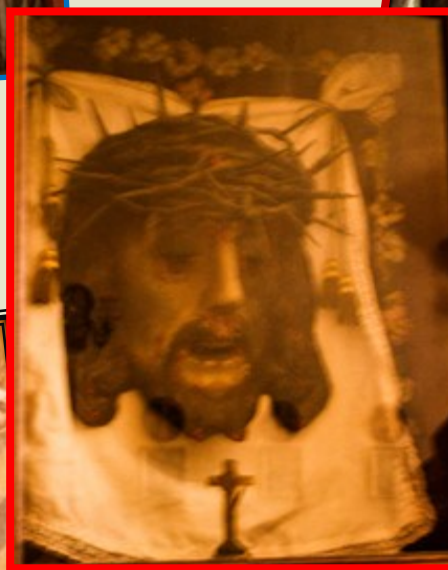
Wiċċ ta' Kristu