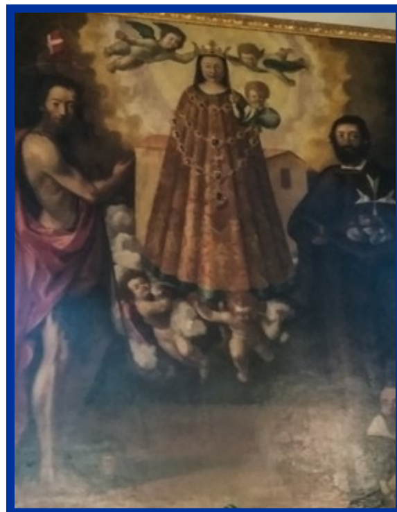
Madonna ta' Loretu