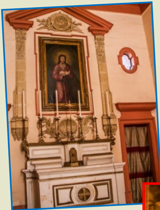
L-altar ewlieni, bit-titular tan-Nazzarenu