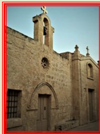
San Bażilju, Mqabba