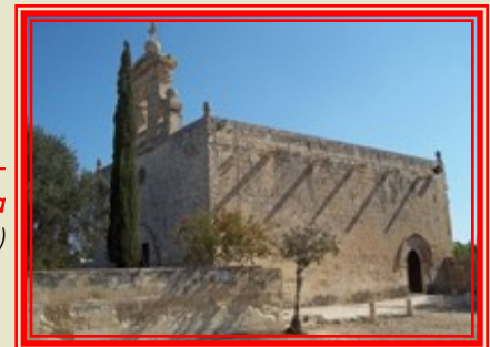
Bir Miftuh - Santa Marija (Rit. Joe Morana)

It-tieni parti tkompli fil-ħarġa li jmiss ta' Mejju