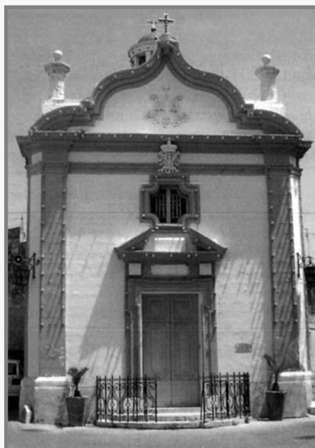
Il-Knisja tal-Vitorja f'Has-Sajjed Birkirkara